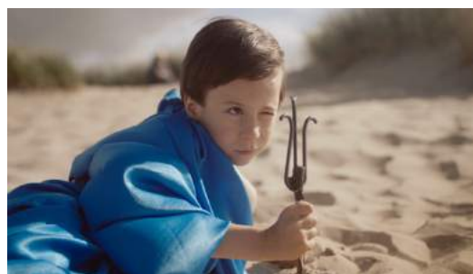
Filmstill AATOS JA AMINE