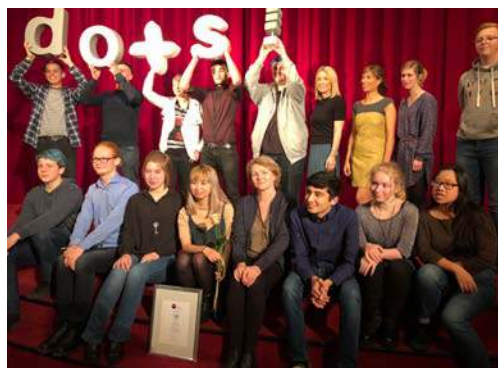
Jury und Preisträger